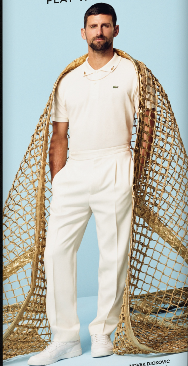
NOVAK DJOKOVIC tenista Belo